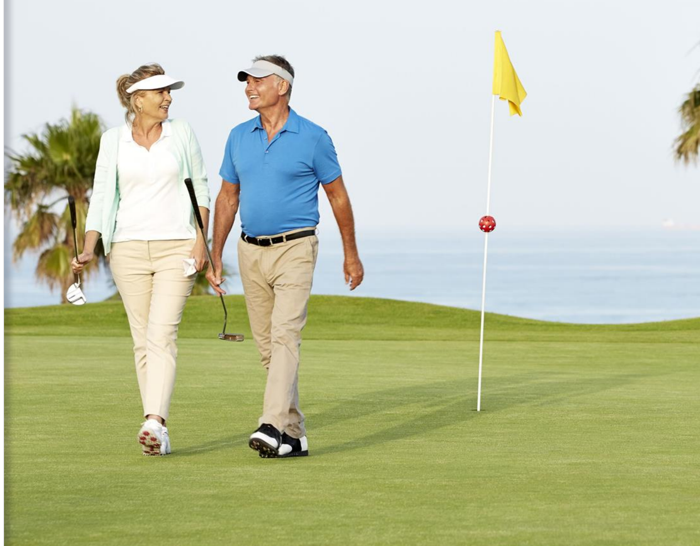
Illustrazione della proposta